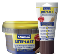
Sapelly Tarro 250 ml Tubo 150 ml