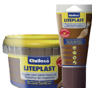
Nogal Tarro 250 ml Tubo 150 ml