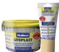
Pino Tarro 250 ml Tubo 150 ml