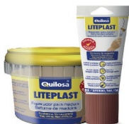
Roble Tarro 250 ml Tubo 150 ml